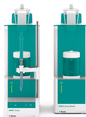
Figure 1. Sistema OMNIS para la medición del valor de saponificación en aceites comestibles que consta de un valorador avanzado OMNIS y un módulo de dosificación OMNIS equipado con un dSolvotrode.

La solución de muestra preparada primero se deja enfriar a temperatura ambiente. A continuación, las puntas de bureta y el electrodo se insertan en el matraz cónico. Se agrega etanol y luego la solución se titula con ácido clorhídrico estandarizado hasta que se alcanza el punto de equivalencia. Posteriormente, el electrodo se limpia con etanol y agua desionizada. Luego, el electrodo se acondiciona sumergiendo el bulbo solo en agua desionizada durante 1 minuto.