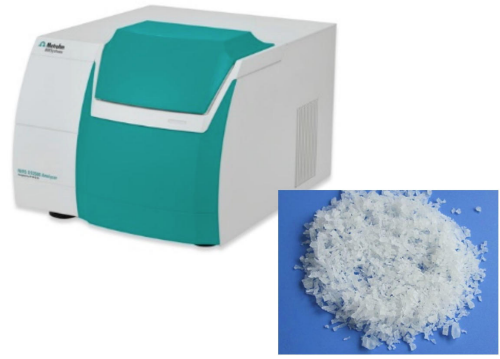
Figure 1. Se utilizó el analizador de sólidos DS2500 para recopilar los espectros del polímero de PVA.

Se recopilaron 54 espectros de 18 lotes de muestras diferentes utilizando un analizador de sólidos Metrohm DS2500 en combinación con el software de espectroscopia Vision Air Complete. Para superar la falta de homogeneidad de la muestra, la medición se realizó con una copa de muestra grande en rotación. Los valores de referencia se obtuvieron por titulación. La detección de valores atípicos se realizó en espectros preprocesados ( 2^{\text{Dakota del Norte}} derivada) usando una distancia máxima en el algoritmo del espacio de longitud de onda. El modelo de predicción NIRS se creó con la configuración descrita en la siguiente tabla y se validó mediante validación cruzada.