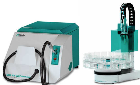
Figure 1. El analizador NIRS XDS OptiProbe y el procesador de muestras robótico 815.

Se recopilaron 17 espectros de muestras con contenido de humedad variable utilizando un analizador Metrohm NIRS XDS OptiProbe en combinación con el procesador de muestras robótico 815. Con la gradilla de muestras grande adjunta, fue posible automatizar mediciones de hasta 62 muestras en serie. Los valores de referencia se obtuvieron por valoración KF. El conjunto de datos que constaba de espectros y valores de laboratorio se dividió en un conjunto de calibración (11 muestras) y un conjunto de validación (6 muestras). La detección de valores atípicos se realizó en espectros pretratados ( 2^{\text{Dakota del Norte}} derivada) usando una distancia máxima en el algoritmo del espacio de longitud de onda.