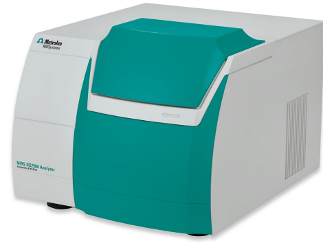
Figure 1. Se utilizó el analizador de sólidos DS2500 para recopilar los espectros de las muestras de fertilizantes.

Se midieron diferentes tipos de productos fertilizantes con un contenido de humedad variable de 0,12 % a 3,82 % utilizando un analizador de sólidos Metrohm DS2500. Para superar la falta de homogeneidad de la muestra, la medición se realizó con una copa de muestra grande en rotación. La recopilación de datos y el desarrollo del modelo se llevaron a cabo con el paquete completo Vision Air. Los valores de referencia se obtuvieron mediante valoración coulombimétrica KF acoplada con horno KF. El modelo de predicción NIRS se creó con la configuración descrita en la siguiente tabla y se validó mediante un algoritmo de validación cruzada.