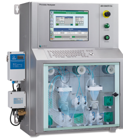
Figure 2. El analizador de procesos a prueba de explosiones (ATEX) ADI 2045TI de Metrohm Process Analytics.

El peróxido de hidrógeno se analiza utilizando un agente complejo seguido de una medición colorimétrica con sonda de inmersión.