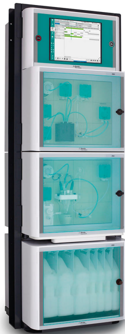
Figure 2. 2060 TI Process Analyzer para el análisis en línea de parámetros críticos de calidad en baños de decapado mediante el método de valoración.

productos químicos se reducen considerablemente. Metrohm Process Analytics ofrece un analizador de procesos multiparamétrico adecuado para el análisis simultáneo de Fe^{2+}/Fe^{3+} y de la relación ácido libre/ácido total en un amplio rango de concentraciones: el analizador de procesos 2060 TI (figura 2) .