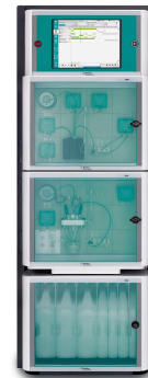
Figure 2. Analizador de procesos 2060.

Para extraer los compuestos adecuados, mantener el pH dentro de las especificaciones y preparar los mismos sabores en múltiples lotes, tanto la alcalinidad como la dureza del proceso y el agua de reposición deben controlarse y mantenerse en los niveles adecuados. Los analizadores de procesos Metrohm Process Analytics 2060 y 2035 ( Figuras 2 y 3 ) son ideales para la ejecución totalmente automática de estos importantes análisis, así como parámetros adicionales como el pH o la conductividad. El analizador de procesos puede enviar una alarma al sistema de control de la planta si los niveles de alcalinidad o dureza no son óptimos, indicando al control de distribución que corrija la química del agua, asegurando una calidad constante del producto.