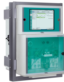
Figure 3. Analizador de procesos 2035.

Además, los sensores de pH en línea se pueden conectar al analizador de procesos 2060 para garantizar un sistema completamente integrado, lo que lleva a un mejor control del proceso.