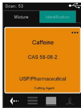
Figure 2. Captura de pantalla real de identificación de cafeína en Yaba con MIRA DS. La cafeína es una sustancia química comúnmente asociada con las drogas ilícitas. El fondo de advertencia amarillo proporciona información inmediata y procesable sobre la naturaleza de la muestra.