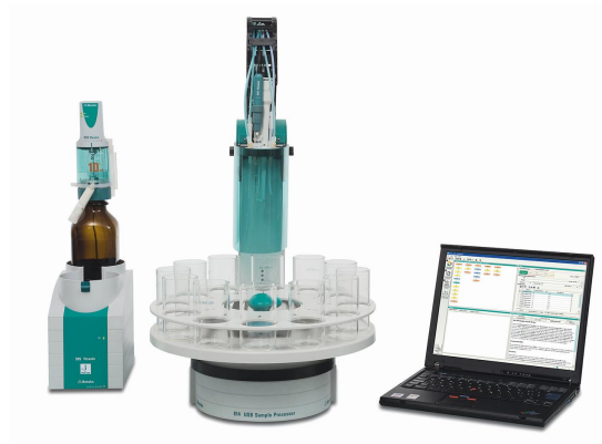
Figure 1. 814 Sample Processor and 905 Titrando equipped with an iAg-Titrode with Ag 2 S coating controlled by tiamo software.

To a reasonable amount of sample, 5 mL of nitric acid is added to acidify the sample. Then, deionized water is added to cover the glass membrane and silver ring of the electrode, and the sample is titrated with standardized silver nitrate titrant until after the equivalence point.