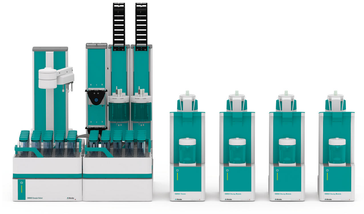
Figure 1. OMNIS Robot S with Discover and parallel analysis.

OMNIS automates the entire analysis process with: