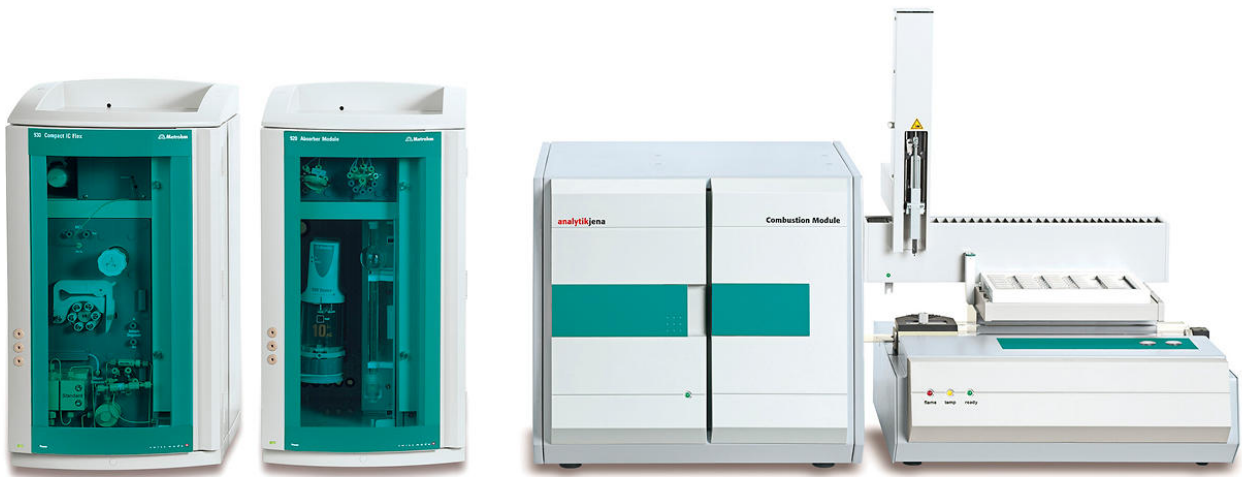
Figure 1. Installation IC de combustion composée d'un 930 Compact IC flex (2.930.2560), d'un module d'absorption 920 (2.920.0010), d'un module de combustion (four + ABD, 2.136.0700) et d'un passeur d'échantillons MMS 5000 (2.136.0800) configuré pour les échantillons solides (6.7302.000).

d'autres halogènes et du soufre) est transféré dans le module d'absorption 920 et absorbé dans la phase aqueuse. Une manipulation précise et automatisée des liquides est effectuée à l'aide de Dosinos pour transférer l'échantillon aqueux dans l'IC (930 Compact IC flex) pour l'analyse. Pour maintenir le bruit de fond et les limites de détection du fluor à un niveau bas, il est essentiel d'utiliser des réactifs chimiques qui sont au moins du grade de pureté "par analyse".