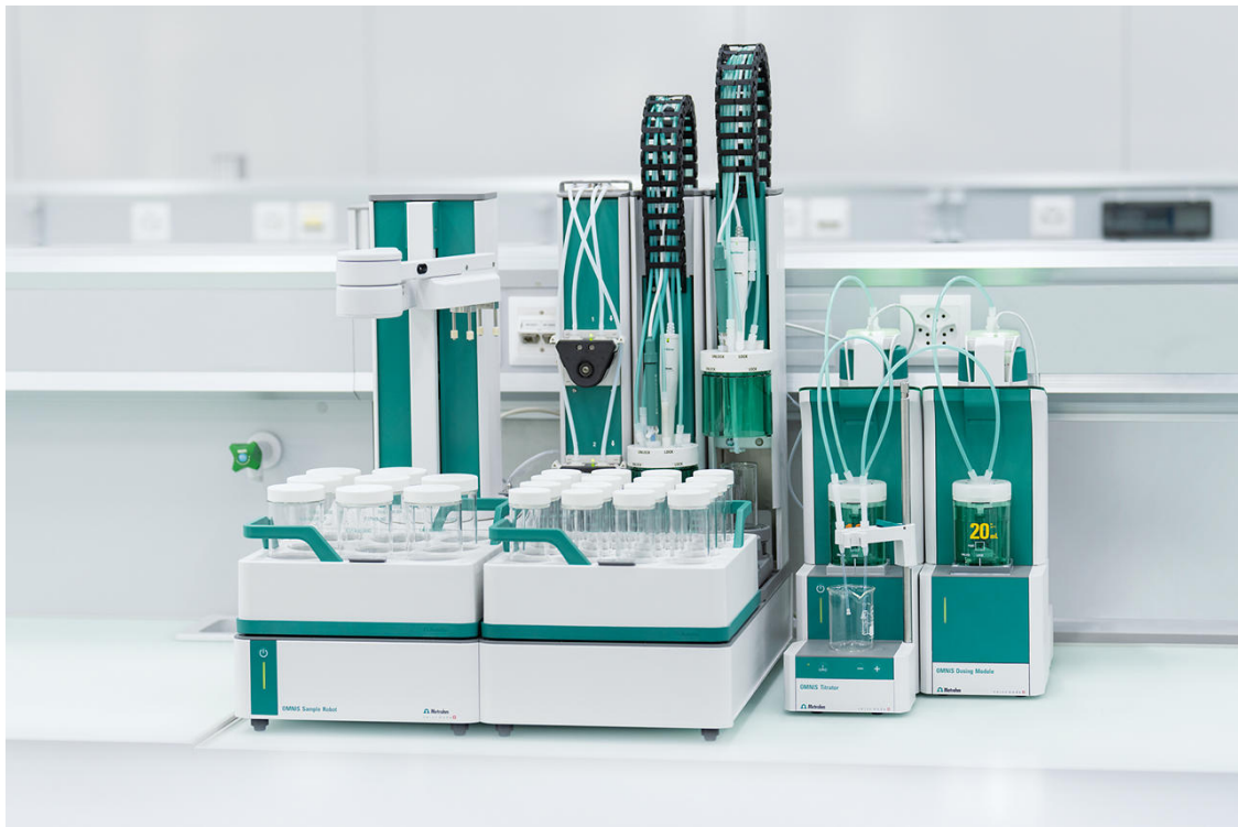
Figure 1. OMNIS Sample Robot S équipé d'un titrateur OMNIS, d'un module de dosage et d'une électrode dUnitrode pour la détermination automatisée du pyrophosphate dans les échantillons aqueux.

\text{Na}_2\text{H}_2\text{P}_2\text{O}_7 + 2 \text{ZnSO}_4 \rightarrow \text{Zn}_2\text{P}_2\text{O}_7 + \text{Na}_2\text{SO}_4 + \text{H}_2\text{SO}_4 Dans la deuxième étape, l'acide sulfurique formé est titré avec de l'hydroxyde de sodium pour déterminer la teneur en pyrophosphate de l'échantillon. La détermination est effectuée avec un titrateur OMNIS équipé d'une dUnitrode sur un robot d'échantillonnage OMNIS S (Figure 1).