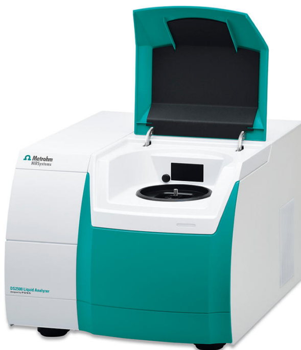
Figure 1. Metrohm DS2500 Liquid Analyzer used for the determination of research octane number (RON) in isomerate samples.