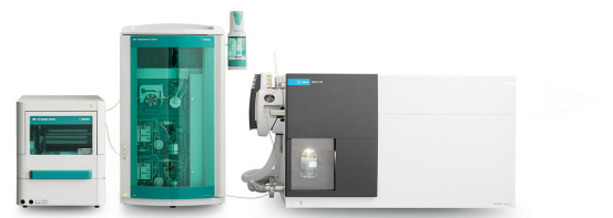
Figure 1. Configurazione strumentale per misurare acidi aloacetici, dalapon e bromato, incluso un 889 IC Sample Center – cool (Metrohm), 940 Professional IC Vario (Metrohm) e 6475 Triple Quadrupole LC/MS con sorgente ionica con tecnologia Jet Stream (Agilent). È stato utilizzato un Dosino per l'infusione diretta nel sistema MS durante l'ottimizzazione del metodo.

La sillabazione dell'HPLC con la spettrometria di massa si è comunemente concentrata sullo studio delle molecole organiche. La cromatografia ionica (IC) con sillabazione con la spettrometria di massa (MS) apre il campo all'analisi altamente sensibile di sostanze ioniche e più polari in soluzioni acquose o matrici contenenti sali. L'utilizzo dell'889 IC Sample Center – cool garantisce un'elaborazione dei campioni stabile e riproducibile a 4 °C (Figura 1) prevenendo il decadimento degli HAA sensibili alla degradazione.