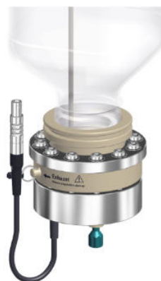
Figure 2. Il modulo IC continuo 948, CEP produce automaticamente l'eluente KOH da acqua ultrapura e un concentrato KOH. La produzione dell'eluente elettrochimico avviene in una membrana nella cartuccia del produttore dell'eluente.

Il cromatografo ionico microbore senza metalli 940 Professional IC Vario con una colonna Metrosep A Supp 19, soppressione sequenziale e un rivelatore di conduttività IC MB ha ottenuto la separazione cromatografica senza interferenze e con un volume vuoto ridotto. Il rilevamento sensibile e selettivo degli acidi aloacetici è stato effettuato con un sistema LC/MS Agilent 6475 triplo quadrupolo dotato di una sorgente ionica con tecnologia Jet Stream Agilent, gestito in modalità di acquisizione di monitoraggio dinamico delle reazioni multiple (dMRM). Il rilevamento della conduttività può essere utilizzato per quantificare in parallelo anioni comuni come fluoruro, cloruro, nitrato o solfato. Un Dosino aggiuntivo consente l'infusione diretta di soluzioni standard nel sistema MS per l'ottimizzazione del metodo, ovvero l'individuazione dei migliori parametri MS per rilevare gli analiti di interesse. Il modulo IC continuo 948, CEP produce esattamente un eluente di idrossido di potassio in concentrazioni comprese tra 15 e 100 mmol/L di idrossido di potassio (KOH) ( Figura 2 ). L'IC è stato gestito con il software MagIC Net e l'MS con il software MassHunter. La sincronizzazione di entrambi gli strumenti era controllata tramite un cavo remoto. La tabella 1 elenca le impostazioni più importanti dello strumento.