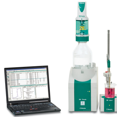
Figure 1. Sistema Titrando costituito da uno strumento 907 in combinazione con tiamo.

Le analisi vengono eseguite utilizzando un Titrando 907 dotato di Solvotrode easyClean. Un'aliquota della soluzione di estrazione viene trasferita in un becher, riempita con etanolo (per immergere la membrana di vetro e il diaframma dell'elettrodo), e quindi titolata con acido perclorico standardizzato in acido acetico glaciale fino al raggiungimento del primo punto di equivalenza .