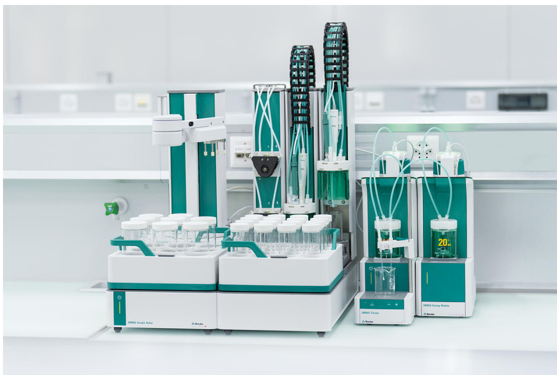
Figure 1. OMNIS Sample Robot S dotato di titolatore OMNIS, modulo di dosaggio ed elettrodo dUnitrode per la determinazione automatica del pirofosfato in campioni acquosi.

La determinazione viene eseguita con un titolatore OMNIS dotato di dUnitrode su un OMNIS Sample Robot S (Figura 1).