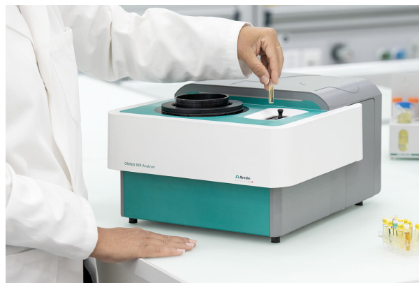
Figure 1. OMNIS NIR Analyzer e un campione sono stati riempiti in una fiala monouso.

Campioni di 1-methoxy-2-propanol con contenuto di acqua variabile (dallo 0,03% al 2%) sono stati misurati con OMNIS NIR Analyzer Liquid in modalità di trasmissione (1.000–2.250 nm). L'acquisizione riproducibile dello spettro è stata ottenuta utilizzando il controllo della temperatura integrato a 30 °C. Per comodità, sono state utilizzate fiale monouso con una lunghezza del percorso di 8 mm che hanno reso superflua la pulizia dei contenitori dei campioni. Il software OMNIS è stato utilizzato per tutta l'acquisizione dei dati e lo sviluppo del modello di previsione.