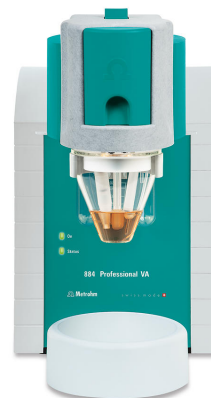
Figure 1. 884 Professional VA manual for MME

Add the sample and the electrolyte solution into the measuring vessel and degas it for 5 min. The interfering effect of chloride is mitigated through the addition of masking analyte. The determination is carried out using parameters listed in Table 1 . Quantification is done with the 884 Professional VA manual for MME ( Figure 1 ) using two standard additions with thiourea standard addition solutions.