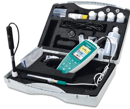
Figure 1. 箱包括所有附件和配 O 2 -Lumitrode 和率传感器的 914 pH/DO/, 用于定淡水流中的溶解。