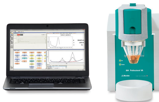
1. 884 伏安

在支持解中稀品后,在884 型伏安上使用MME多模式作工作,使用表1中列出的参数行法定。的度通准加入法求得。